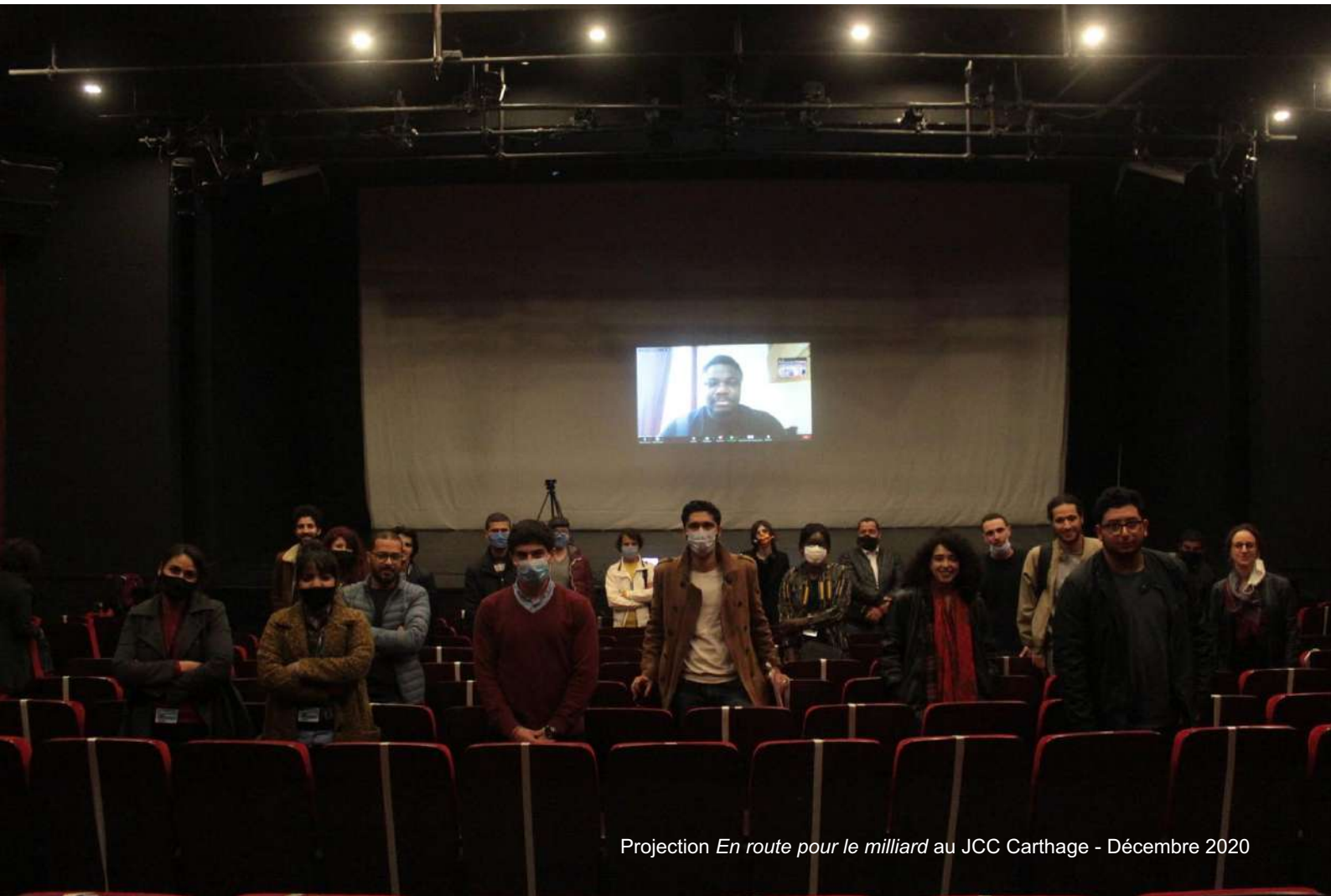
Projection En route pour le milliard au JCC Carthage - Décembre 2020

M.B. : Votre film tourne beaucoup en festivals cette année... En ligne... Comment réagissez vous à toutes ces diffusions du film dans le monde ? Et en RDC ? Qu'est-ce que vous voyez de la réception du public ?